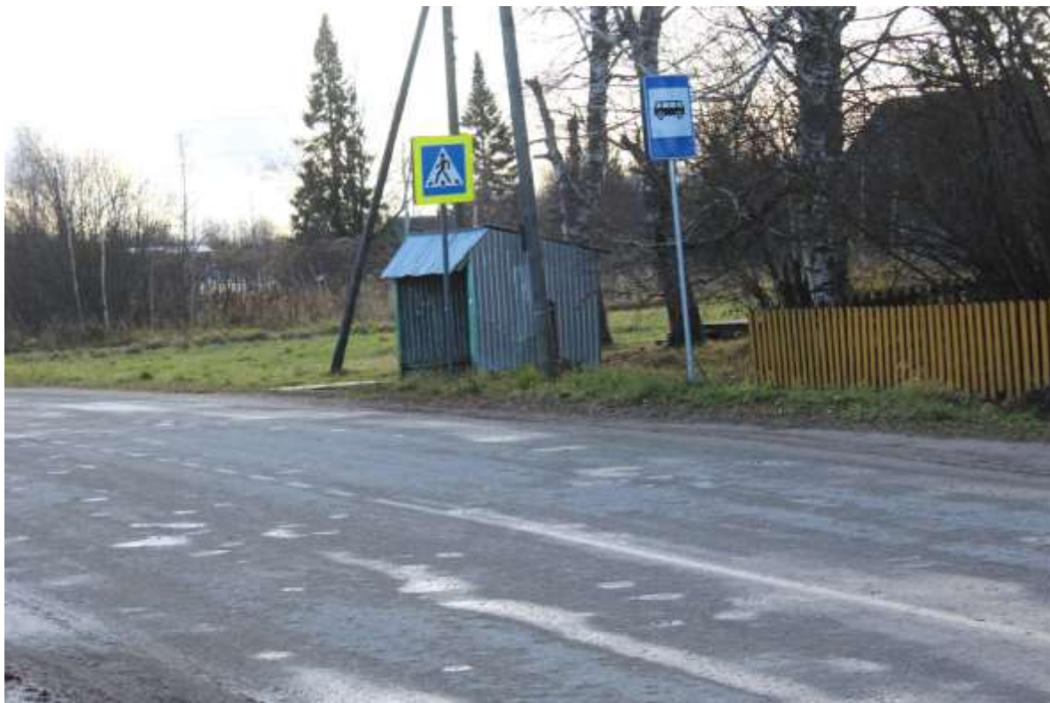
Остановка перед домом культуры на противоположной стороне дороги

Путь следования к объекту пассажирским транспортом – проезд на общественном пассажирском транспорте до остановки на автобусе или такси/личный автомобиль. Расстояние от объекта до остановки общественного транспорта – 50 м. Время движения пешком – 1 минут. По пути следования имеется нерегулируемый пешеходный переход. От остановки до объекта перепады высоты на пути отсутствуют.